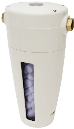
Generador de cloro