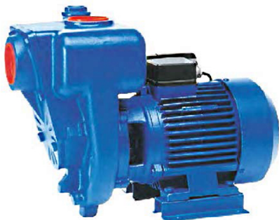
5452 bomba centrífuga autoaspirante