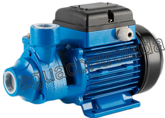
5450 Bomba periferica 0,5 c.v