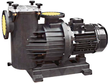
5411 Bomba centrífuga gran caudal con prefiltro piscinas