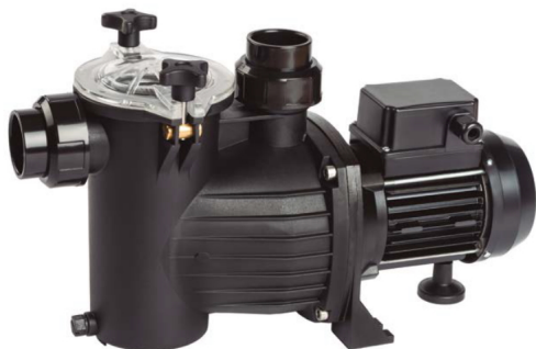
5400 Bomba centrifuga piscinas y spas