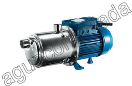
Bomba centrifuga multicelular Inox 1 c.v.230 v Monf.