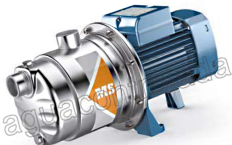
Bomba centrifuga multicelular 0,7 c.v.230 v M