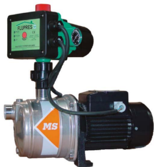
Bomba centrifuga multicelular 0,7 c.v.230 v M