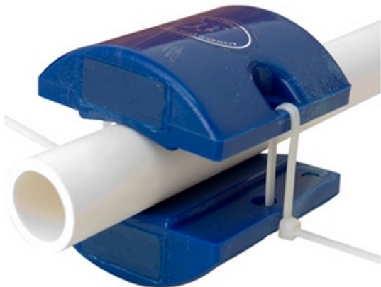
Descalcificador Antical Magnético Jardines y Huertos Neodimio